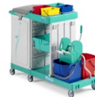
Magic Line 350P